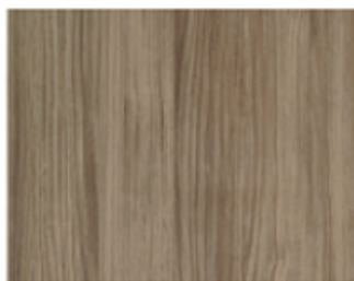
TROPEA COFFEE struktura dřeva