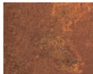
CORTEN hladká struktura