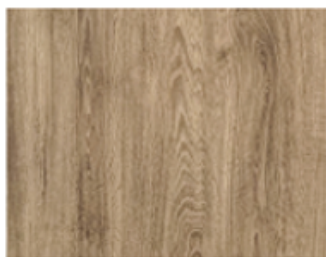
DUB AMBER struktura dřeva